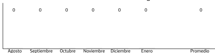
Histórico consumo minutos/segundos

Dirección de Domicilio: BOGOTA DC - BOGOTA DC