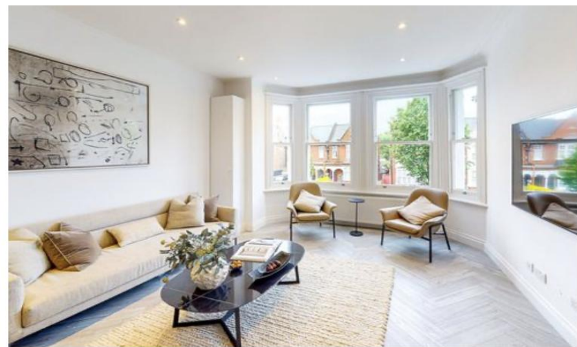
CHISWICK GROVE PARK