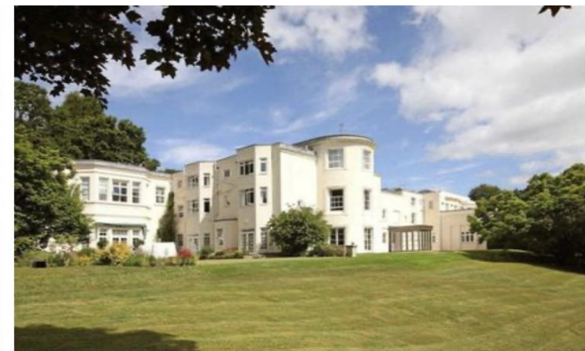
WENTWORTH DORMY HOUSE