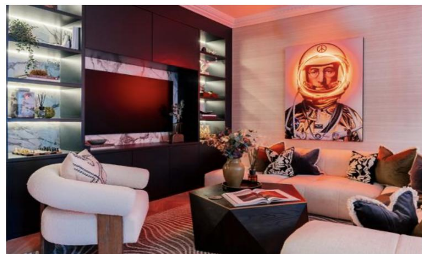
WIMBLEDON SPRINGFIELD ROAD