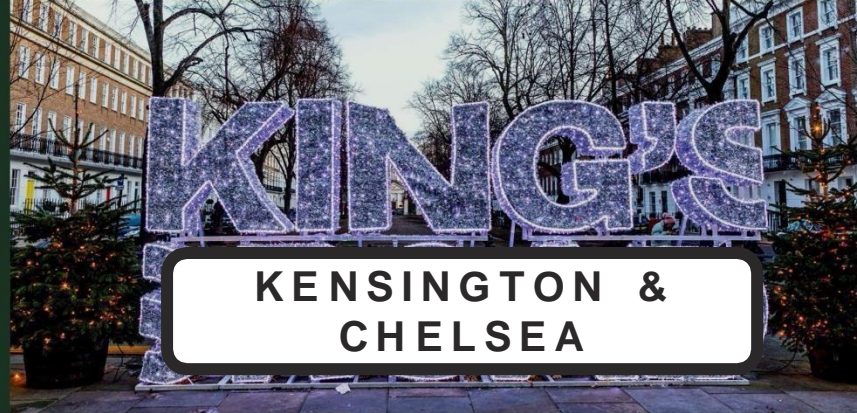
KENSINGTON & CHELSEA