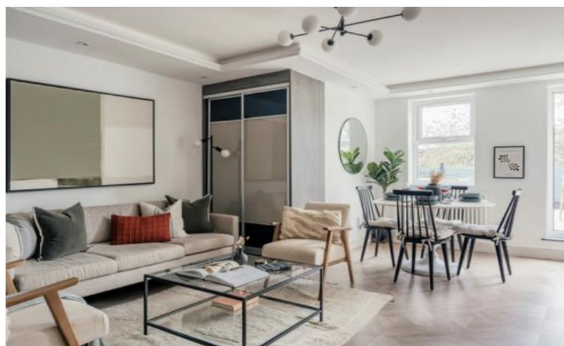
BATTERSEA DOROTHY ROAD