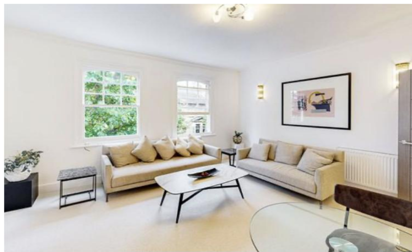
WEST KENSINGTON TURNEVILLE ROAD